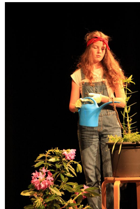
ZOOM SUR LE THÉÂTRE !

* « Coup d'oeil » e galleg / en français